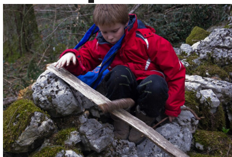
Enfant lors d'un stage BAFA "Grands Jeux d'extérieur" aux Fins