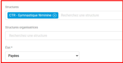
Image 3 - Commission technique régionale, des champs supplémentaires.

Selon votre structure, le module d'exportation peut présenter des champs supplémentaires.