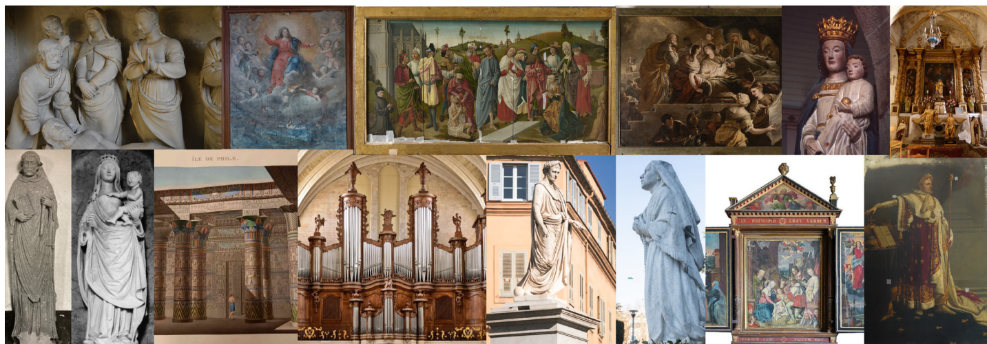
Les œuvres lauréates en 2022